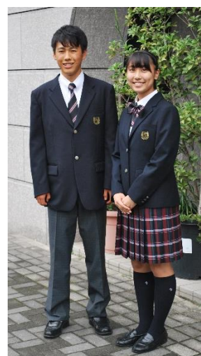
平成30年春より、 制服が新しくなります。